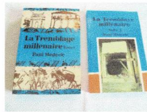
Livres ( BOOKS) La Tremblaye millénaire 1-2 10$ chaque (each).JPG