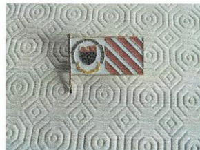
Épinglette (PIN) du 35e 10.JPG