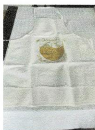
Tablier de cuisine (kitchen apron) 5$.jpg