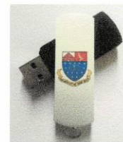
Clé USB (KEY) Nouveau (NEW) Répertoire des Tremblay d'Amérique 25$. bmp