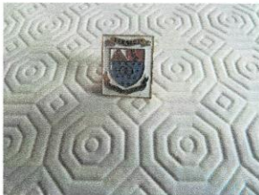
Épinglette (pin) 5$.JPG