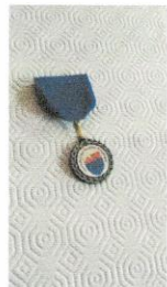
Médaille (medallion) 40e de l'ATA 10.jpg