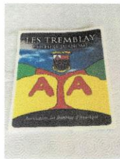
Livret (booklet) Les Tremblay et leurs surnoms 8$.jpg