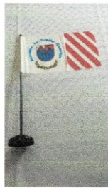
Drapeau de table (table flag) 10$.jpg