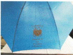
Parapluie de golf (golf umbrella) 25$.JPG