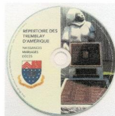
CD Nouveau (New) Répertoire des Tremblay d'Amérique 20$.bmp