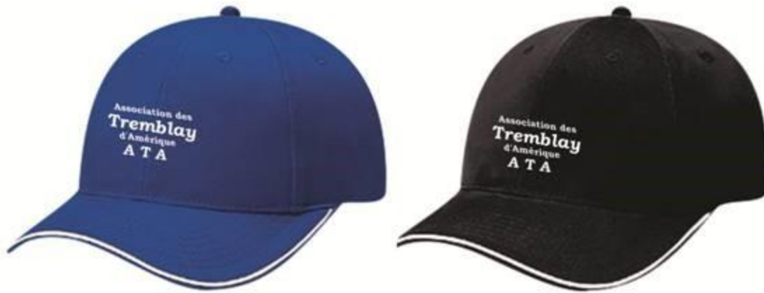
(NOUVEAU) Casquette officielle de l'ATA – (NEW) ATA's official cap