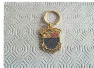
Porte-clés (key chain) 5. JPG