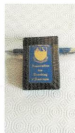
Jeux de carte (playing cards) 7$.jpg