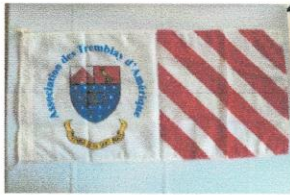
Grand ou demi drapeau pour mât (large or half flag) 125 et 50$.JPG