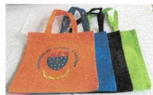
Sac utilitaire (practical bag) 4 couleurs ( 4 color) chaque (each) 7$.jpg