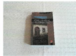
Livre (BOOK) Pierre Tremblay, laboureur 25$.JPG