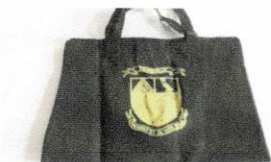
Porte document noir (Black soft briefcase) 5$.jpg