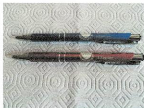
Stylo (pen) 5$.JPG