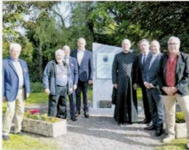
L'association des Tremblay de France tiendra son assemblée générale dans l'Est l'an prochain

appris qu'il y avait une délégation des Tremblay au Québec et il fallait faire quelque chose de notre côté comme une grande fête rassemblant